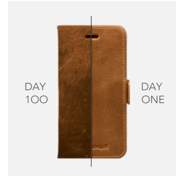
Full Grain läder utvecklar en snygg patina över tid.

Inget av de hudarna vi använder som råmaterial kommer från nötkreatur som föds upp för sina hudar, alla våra hudar är biprodukter från kött- och mejeriindustrin. Dessutom är läder ett mycket hållbart material som åldras graciöst och utvecklar en patina jämfört med andra ytmaterial.