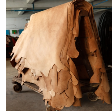
Lädet vi använder till våra produkter är en biprodukt från kött och mejeriindustrin.