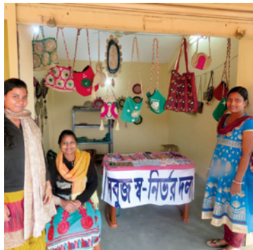
Skill Development Projects