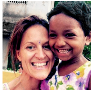
Centre for Special Education