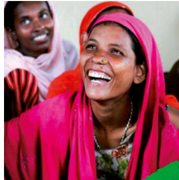
Learning Centre for Tribal Youth

LittleBigHelp är en dansk frivilligorganisation som stöder över 900 utsatta barn och vuxna direkt varje dag och mer än 1000 familjer indirekt genom 6 olika projekt i Kolkata, Indien.