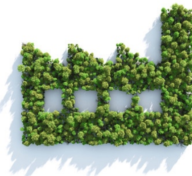
Konsoliderade våra befintliga fyra fabrikslokaler till en fabrik med sex våningar

Vår fabrik drivs helt av solen, via solpanelerna på fabriken tak, producerar vi 100% koldioxidfritt eftersom våra hantverkare gör alla produkter med förnybar energi och traditionella metoder som kräver minimal eller väldigt lätt maskinanvändning såsom symaskiner.