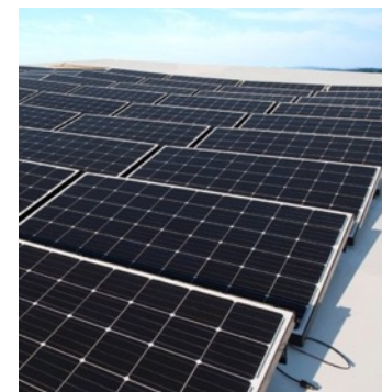
Fabriken och dess maskiner drivs helt av solpaneler på taket.